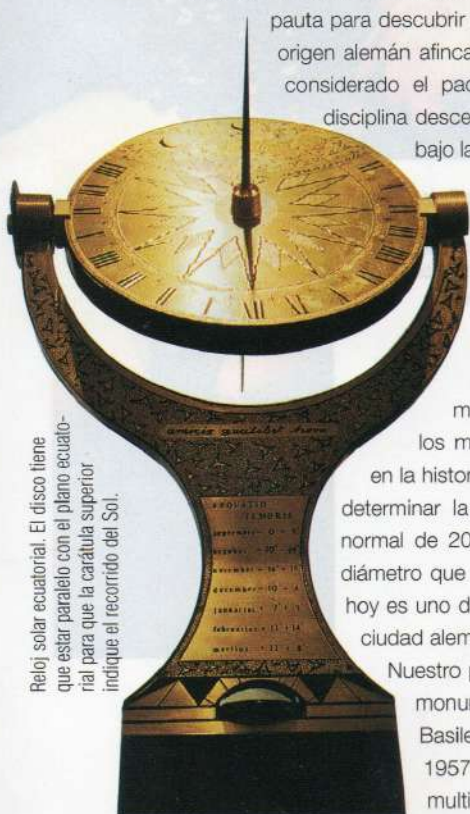
Reloj solar ecuatorial. El disco tiene que estar paralelo con el plano ecuatorial para que la carátula superior indique el recorrido del Sol.