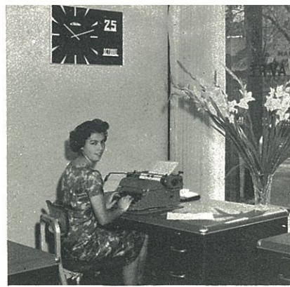
Banco LONGORIA Suc. Hamburgo y Havre

Este provechoso afán de dar algo útil a cambio de los beneficios de la publicidad no se limita a los vehículos convencionales del anuncio: la prensa, la radio, la televisión; sino