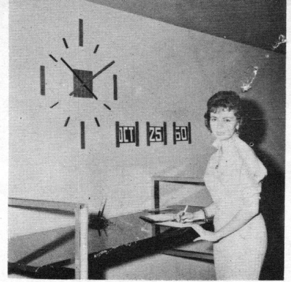
Banco CONTINENTAL, Flores No. 17

Pida usted informaciones y datos adicionales de estos proyectos a nuestro representante en su próxima visita. También estamos dispuestos en casos especiales, a participar en el costo, porque una propaganda efectiva de esta índole, indudablemente influirá favorablemente sobre la venta de nuestra marca ULTRAMAR .