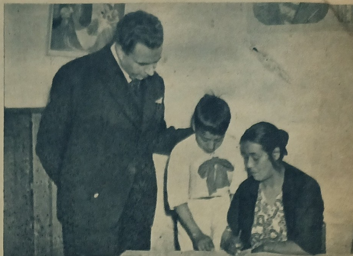
1943: Campaña de alfabetización: Bajo el régimen de Avila Camacho, Torres Bodet —secretario de Educación—, da principio a un esfuerzo educacional en función de las mayorías.