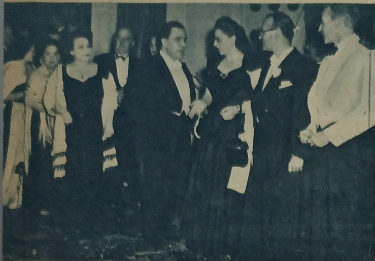
1940: La Diplomacia: Torres Bodet se mantiene en la adquisición de experiencias de carácter universal; seis años más tarde, ocuparía la cancellería nacional.