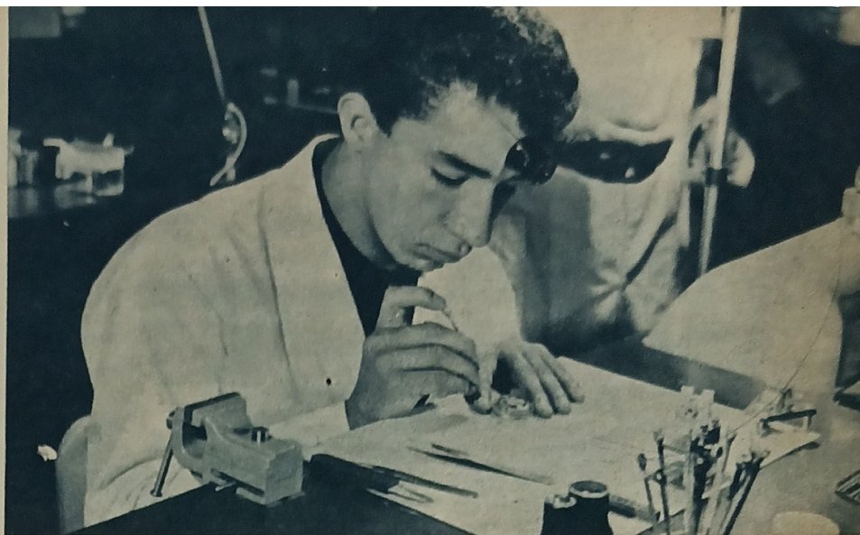
TODOS LOS JOVENES MAYORES DE 15 AÑOS y con instrucción primaria completa, podrán inscribirse en esta escuela de capacitación profesional.