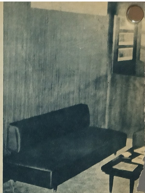
LAS HERRAMIENTAS DE PRECISION necesarias para el mantenimiento de relojes.