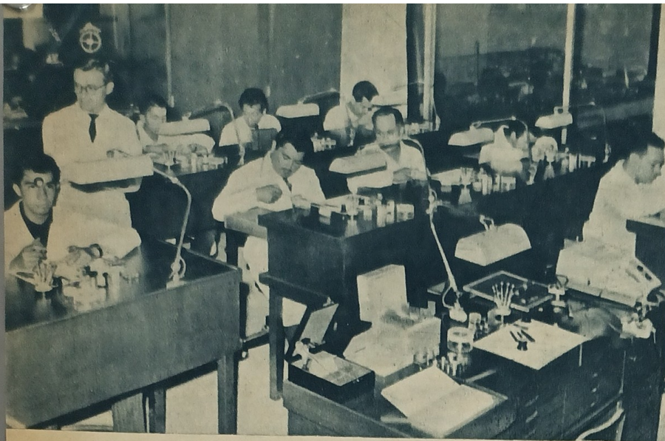
EL TALLER MODELO PROPORCIONARA A LOS ALUMNOS DE LA ESCUELA LA CAPACITACION TECNICA profesional que los habilite como relojeros de precisión.