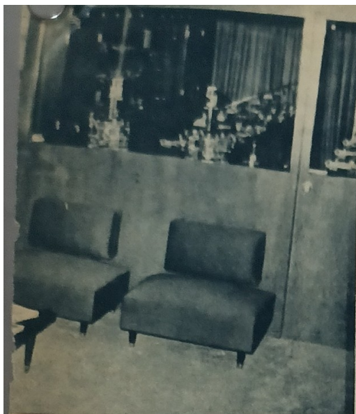
así como para la fabricación de partes, son puestas al servicio de los alumnos del Centro.